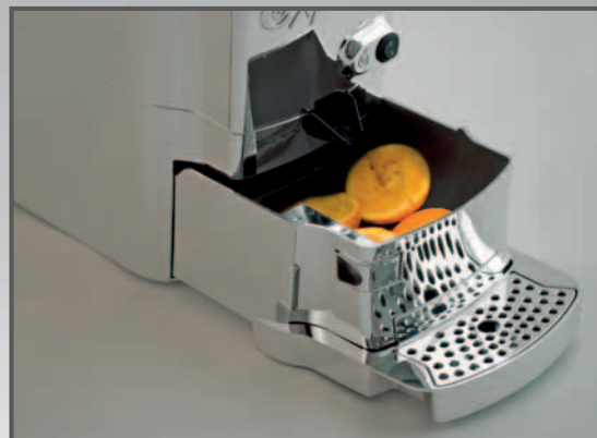
wide extractable spent peels container to collect up to 15 oranges, equipped with a special "pull handle" to spread the peels inside gran recipiente desmontable para las cortezas con una capacidad de hasta 15 naranjas, equipado con un rastrillo que dispersa las cáscaras al interior