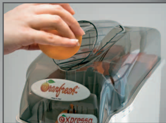
insertion of the whole oranges introducción de las naranjas enteras

Expressa deluxe, un exprimidor de cítricos prestigioso y funcional para resultados deliciosamente superiores.